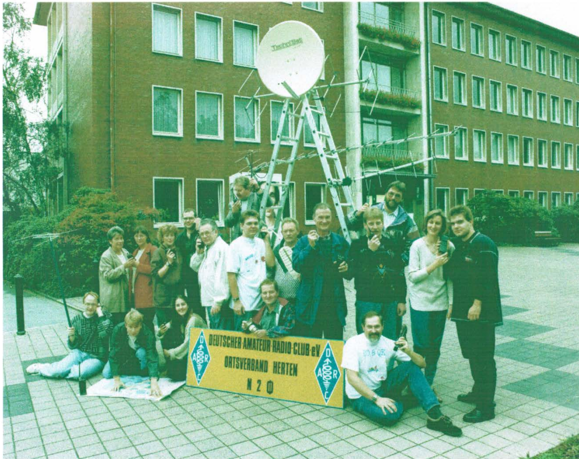
Aufnahme – etwa 1994