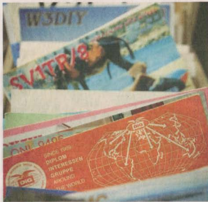
Trophäensammlung: Zahlreiche sogenannte QSL-Karten von Funkamateuren aus der ganzen Welt haben die beiden Hobbyfunker gesammelt.

Funkamateure aus Herten haben 30 Mitglieder / „Es ist richtig was los“