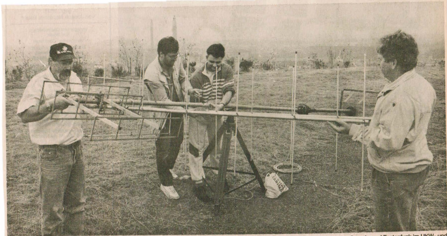
Noch im Dunst des Morgens bauten die Mitglieder des DARC Herten ihre Antennen auf, um den besten Empfang erreichen zu können. Sprech- und Tastenfunk im UKW- und Kurzwellenbereich demonstrierten sie auf dem Gipfel der Halde Hoppenbruch.