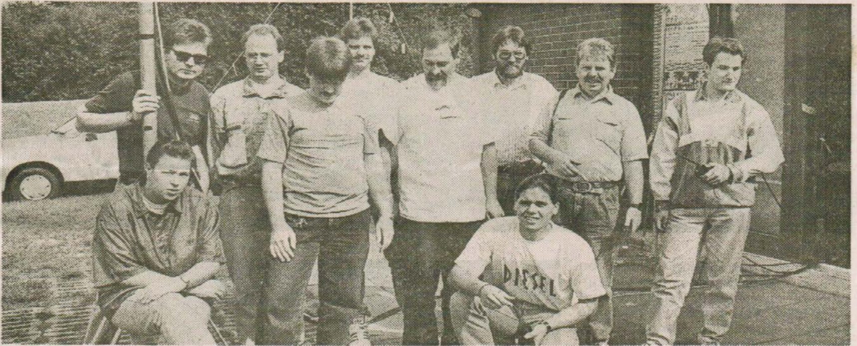
FUNKVERKEHR RUND UM DIE UHR auf allen Frequenzen: Im Jugendzentrum Nord fand am Wochenende der Aktivitätstag der Hertener Amateurfunger statt. Mit Funkern aus aller Welt wurde bis in den frühen Morgen Kontakt aufgenommen. Kuchen und Grillwürstchen sorgten für gute Kondition, um die lange Funknacht durchstehen zu können.

Nr. 215 / H1 / Montag, 14. September 1992